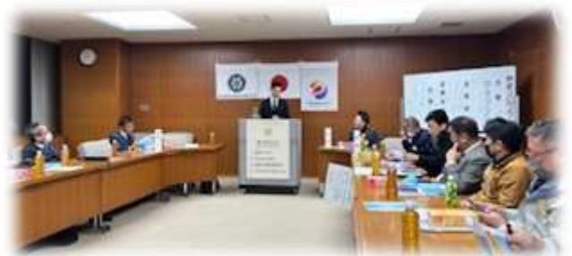
多和田さん、有難う御座いました。